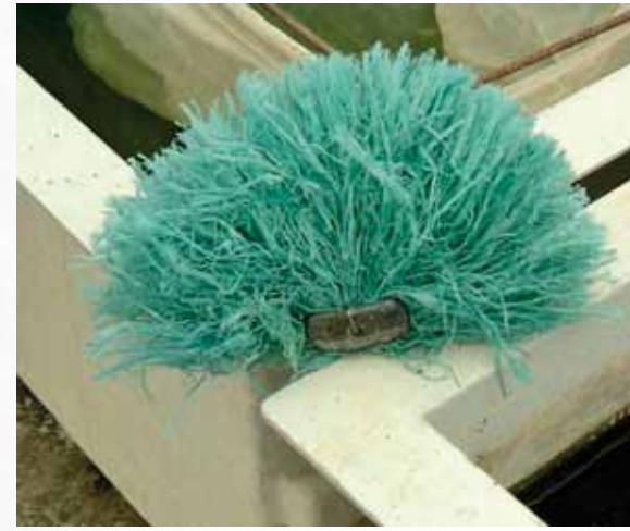
Support de ponte en raphia synthétique.

La ponte commence : les femelles accompagnées de plusieurs mâles prennent appuis sur les frayères pour libérer simultanément leurs ovules et la laitance permettant ainsi la fécondation en pleine eau.