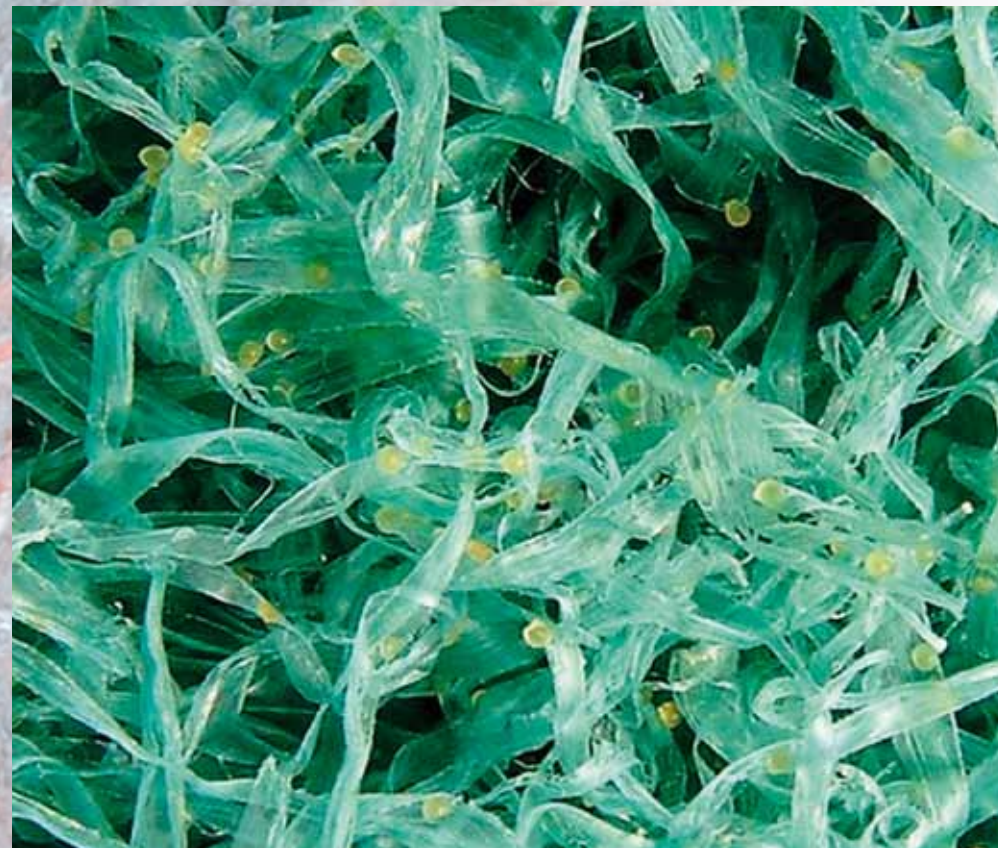
Détail, Oeufs de poissons rouges (2mm) "collés" aux fibres du support de ponte

4 Embryogénèse : Ensemble des transformations successives par lesquelles passent l'œuf et l'embryon de la fécondation à l'éclosion ou à la naissance.