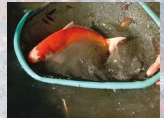
choix de géniteurs de carpes