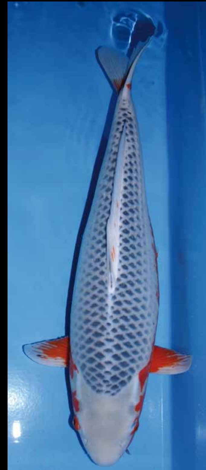
SAGI Femelle Sansai (3 ans) de 59 cm, éleveur HIRASAWA. BEAUCOUP DE POTENTIEL : Ce poisson a été élu «MEILLEUR POISSON DANS LA VARIETE» et 1 er PRIX LA CATEGORIE «ASAGI/SHUSUI» TAILLE 5 AU KOI SHOW DE INTERKOI 2008. (Oasis)

A l'instar de nos collègues allemands, Nous allons dans le guide d'achats qui suit développer les offres en « belles koï » reçues de nos annonceurs. En quelque sorte, un "traveling" sur les offres du marché. Vous pourrez ainsi au fil des éditions repérer les sujets qui vous intéressent et contacter la jardinerie ou l'éleveur qui les proposent.