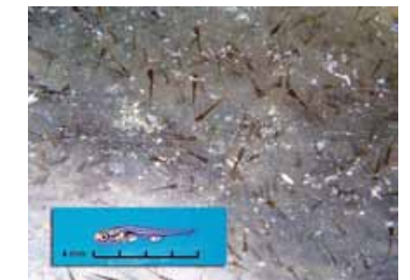
Larve à vésicule résorbée de poisson rouge.