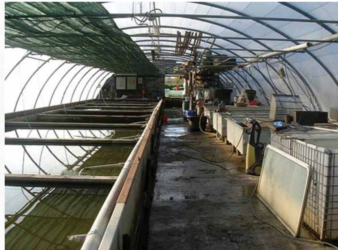
Vue de l'écloserie, à gauche : les bassins de reproduction des carasins, à droite : les incubateurs pour supports de ponte.