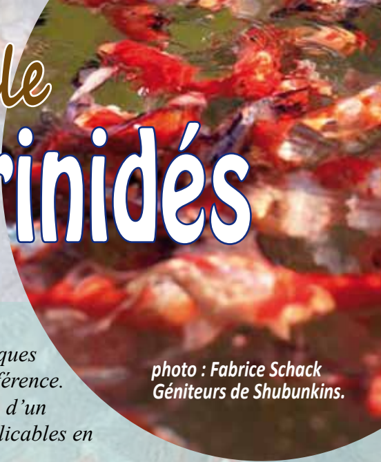
Géniteurs de Shubunkins.

Nous avons dans JDA ...abordé la reproduction des carpes Koi. Il s'agissait des méthodes de reproduction « forcées » appliquées par les pisciculteurs. Des techniques qui n'étaient pas reproductibles par les particuliers mais qui avaient valeur de référence. C'est pourquoi, nous avons livré l'information. Nous vous annonçons la parution d'un article sur les méthodes « naturelles » de reproduction, celles là parfaitement applicables en bassin d'agrément.